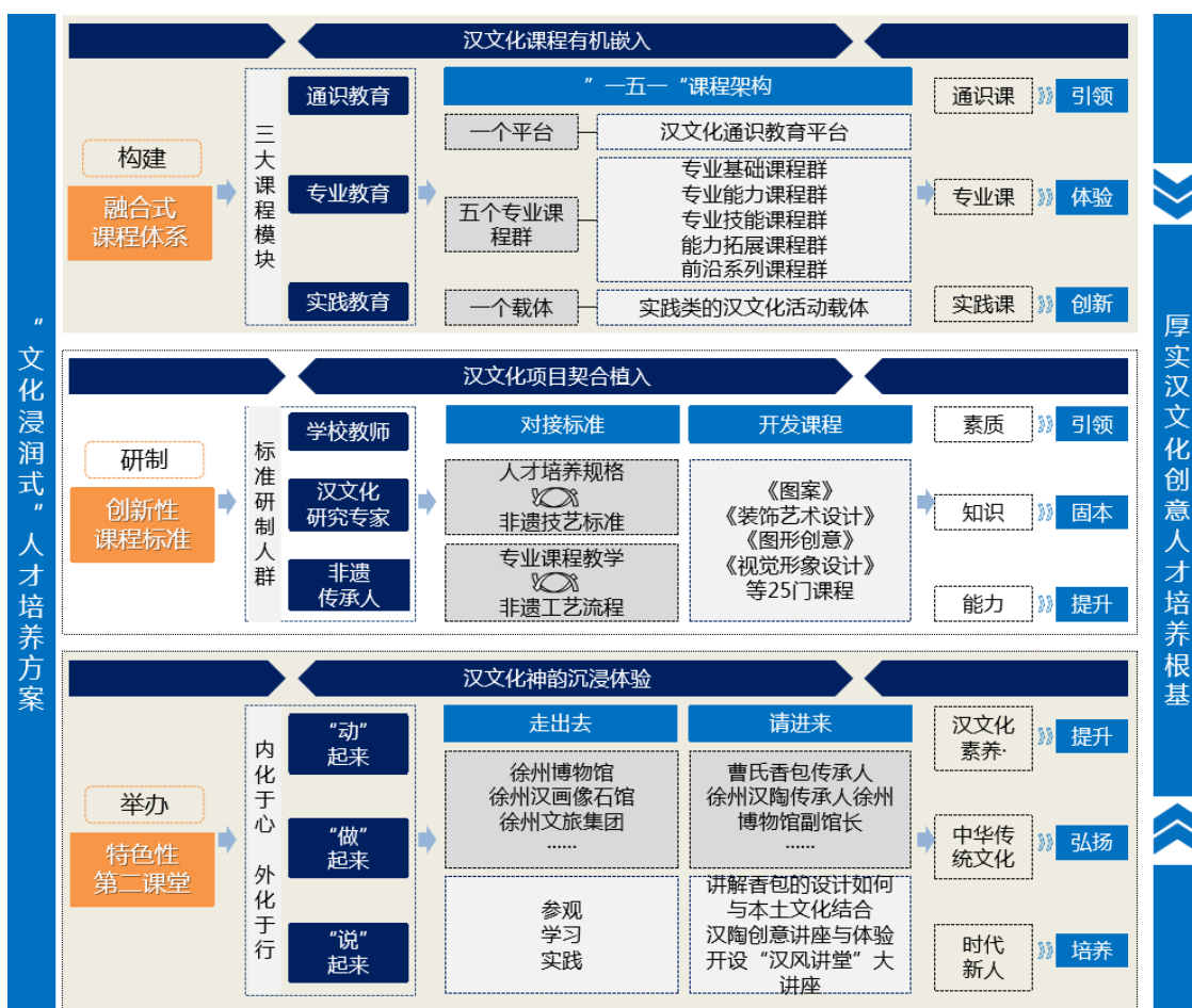
图2 “文化浸润”人才培养方案构建

“五维联动”，政校行企共订“文化浸润”培养方案、共育“匠师协同”教学团队、共建“立体体验”实践基地、共搭“数字赋能”创新平台、共享“传承创新”文化成果，打造融合式、全程化、进阶性、开放性人才培养体系，引导学生吸收优秀文化，萃取思想精华，推动文化创意产业高质量发展（图2—图4）。